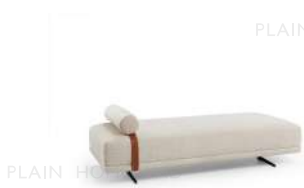
诺拉 / 长踏 BA55298-B 180Wx81Dx58H(cm)