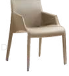
西雅图 / 餐椅 Y6017-2 55.5Wx56.5Dx80H(cm)