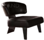
里维斯 / 单椅 SS39287