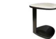
鹅卵石 (岩板) / 茶几 ST90008 50Wx50Dx54H(cm)