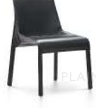
青墨 / 餐椅 Y6017 56Wx54Dx78H(cm)