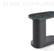
鹅卵石 (大理石) / 茶几 ST30031 50Wx50Dx53H(cm)