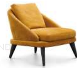
华莱士 / 单椅 SS66637