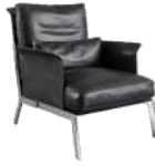
钢铁侠 / 单椅 SS66614