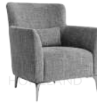
德拉 / 单椅 SS66602