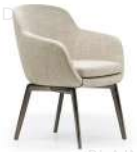
贝特 / 餐椅 DC39267 66Wx63Dx80H(cm)