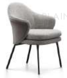
安格 / 餐椅 DC39209 63Wx60Dx81H(cm)