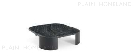
鹅卵石 (大理石) / 茶几 ST30029 120Wx109Dx27H(cm)