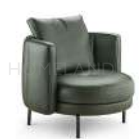
托里 / 单椅 SS39217