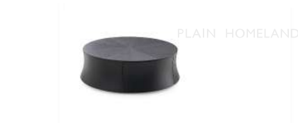
圆鼓 / 茶几 ST38244 80Wx80Dx27H(cm)