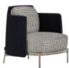
磁带 / 单椅 SS39245-1