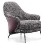
安格 / 单椅 SS39244