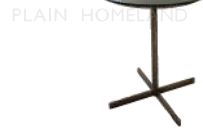
杰瑞 / 边几 ST95008J-A 46Wx46Dx43H(cm)