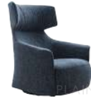
诺娃 / 单椅 SS39114