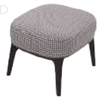
格林 / 方踏 SS55544-8 63Wx53Dx40H(cm)