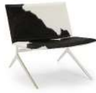
牛奶 / 单椅 SS66685