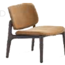
优可 / 单椅 SS39251