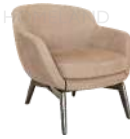
塔尔 / 单椅 SS39305