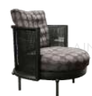
托里(藤编) / 单椅 SS39218