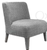
塞西尔 / 单椅 SS66698