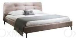
安妮 / 床 BA66609

1.5床外框: 233Wx192Dx91H(cm) 1.8床外框: 233Wx222Dx91H(cm) 2.0床外框: 253Wx242Dx91H(cm)