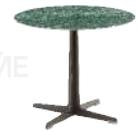
雪花绿圆 / 边几 ST53134