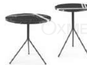
三角 / 边几组合 ST30993-L/S

茶几: 100Wx100Dx30H(cm) 边几: 50Wx50Dx48H(cm)