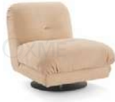
云朵 / 单椅 SS39014-1B