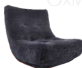
ALLAN / 单椅 SS39179A