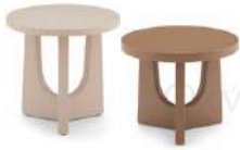
U形 / 边几组合 ST53225-0C/ST53226-0C

大: 45Wx45Dx35.5H(cm) 小: 42Wx42Dx40.5H(cm)