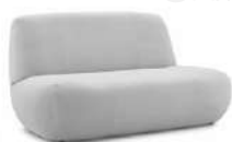
YUKI / 单椅 SS55621-2