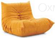
TOGO / 单椅 SS55701-1