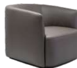
莫尼卡 / 单椅 SS66654