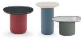
托盘 / 边几组合 ST50101/ST50103/ST50102

茶几: 100Wx100Dx32.5H(cm) 边几: 45Wx45Dx50.5H(cm) 边几: 55Wx55Dx41.5H(cm)