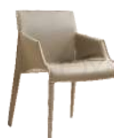
酷可 / 餐椅 Y6017-2