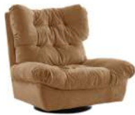
云朵 / 单椅 SS39115