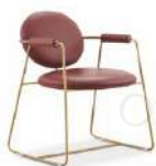
如意 / 餐椅 SS55522