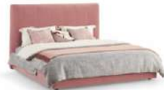
琴键 / 床 BA55531

1.5床外框: 218Wx221Dx131H(cm) 1.8床外框: 218Wx251Dx131H(cm)