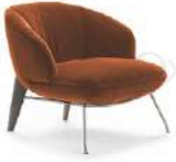
佩洛 / 单椅 SS55575