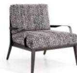
香奈儿 / 单椅 Y6003