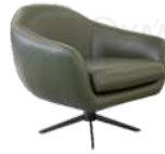
赫兹 / 单椅 SS66658