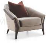
钻石 / 单椅 SS55394