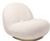
小白 / 单椅 SS39227