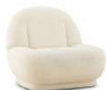
大白 / 单椅 SS39324