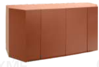
伯格 / 边柜 DH38341