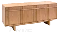
博德 / 边柜 DH38339