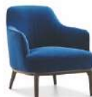
凯特 / 单椅 SS55383-1