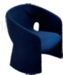
新品 / 单椅 SS39165