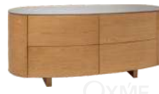
劳德 / 边柜 DH38334