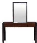
拾方 / 妆台 BT53217

妆台: 128Wx46Dx75H(cm) 妆镜: 98Wx62Dx40H(cm)