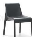
酷可 / 餐椅 Y6017