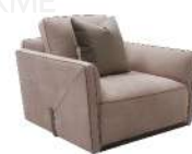
信封 / 单椅 SS55393-1