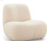
YUKI / 单椅 SS39273