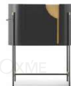
黑金系列 / 酒柜 DW53234