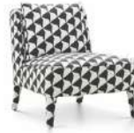
伊莎贝拉 / 单椅 SS55584