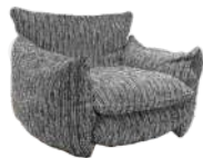
拥抱 / 单椅 SS66699