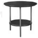
黑曜 / 边几 ST50100-B