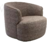
莱恩 / 单椅 SS66700